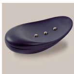
Meteor blå ref: AV_ME01