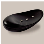
Meteor svart ref: AV_ME02