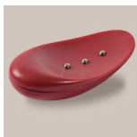
Meteor rød ref: AV_ME03